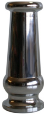
B.21.CA001 GRANADINO C. LATON/CROMO