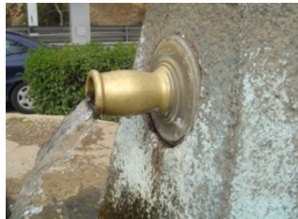
B.21.CA030 CAÑO DESPEÑAPERROS

MATERIALES: BRONCE/LATON --ACABADOS: NATURAL Y CROMADO