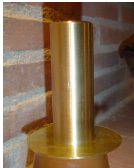
B.21.CA025 CAÑO RECTO