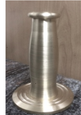
B.21.CA0010 CAÑO R. S. VICENTE