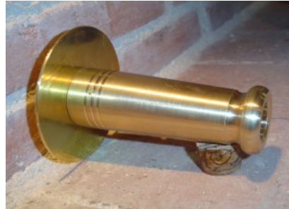
B.21.CA003 GRANADINO LARGO